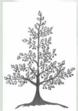
Frühzeitiger Ertragsseintritt, gute Erntbarkeit