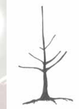
Pflanzung eines Baumes auf schwacher Unterlage