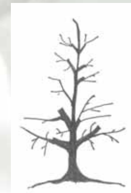
Entfernung zu starker Seitenäste auf langen Zapfen