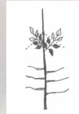
Pinzieren eines Baumes im oberen Kronenbereich