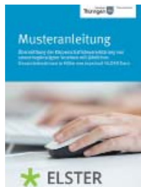
Keine Angst vor Computer und ELSTER – die Schulung zeigte, wie es gut und unkompliziert geht.