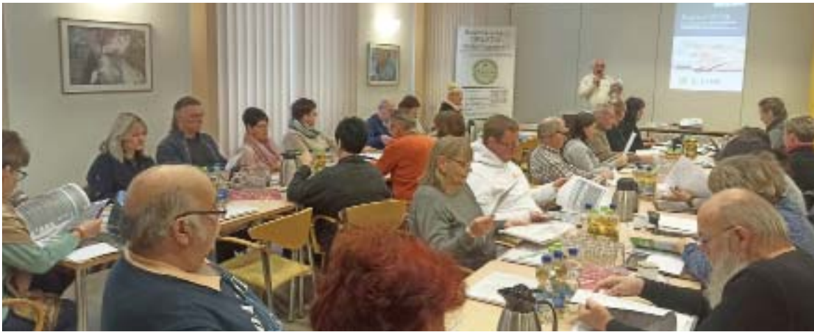
Jeder ehrenamtlich Tätige im Vorstand eines Kleingärtnervereins bzw. -verbandes opfert einen guten Teil seiner Freizeit auch dafür, um sich in Schulungen das erforderliche Wissen für sein ehrenamtliches Wirken anzueignen.

Jeder, der in einem Verein tätig ist, weiß, wie schwer es ist, neue engagierte Mitstreiter für die Führung (s) eines Vereins zu finden. Viele Personen sind begeistert, was so ein Verein alles leistet und im Ort bewirken kann, aber die meisten davon scheuen sich davor, ein Ehrenamt im Vorstand oder gar in einem Verband zu übernehmen. Oftmals liegt es daran, dass sie der Meinung sind, noch nicht bereit zu sein, eine solche Aufgabe erfolgreich meistern zu können.