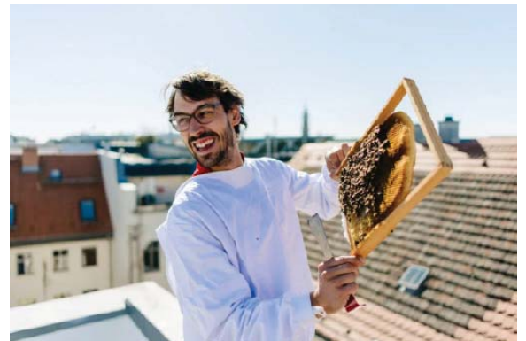
Mit der kompakten BienenBox ist die Imkerei sogar auf den Dächern hoch über der Stadt möglich.