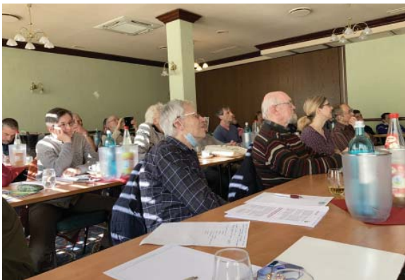
Im RV Jena/Saale-Holzland-Kreis haben die Winterschulungen für Fachberater eine lange Tradition.

Da von den 46 anwesenden Gartenfreunden zwei Drittel „alte Hasen“ in der Vorstandsarbeit waren, konnten sie wertvolle Tipps an die neuen Vorstände weitergeben. Die Vorstandsmitglieder des Kreisverbandes, haben jahrelange Erfahrung im Kleingartenwesen in ihren Vereinen erworben, stehen auch in den wöchentlichen Sprechstunden allen Vorständen mit Rat und Tat zur Seite. Elke Übensee