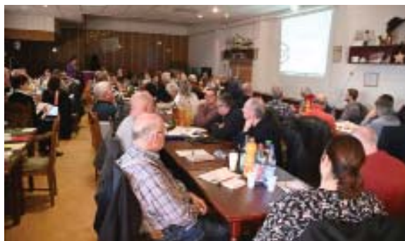
Mehr als 30 Vereinsvertreter hatten sich zur Schulung im Vereinsheim des KGV „Ost“ Altenburg eingefunden.

Für die rund 60 Teilnehmer aus über 30 Mitgliedsvereinen des Regionalverbandes begann die Schulung mit Einblicken und Überblicken zu den Versicherungsarten Vereinshaftpflicht, Vermögensschadenshaftpflicht sowie Rechtsschutz.