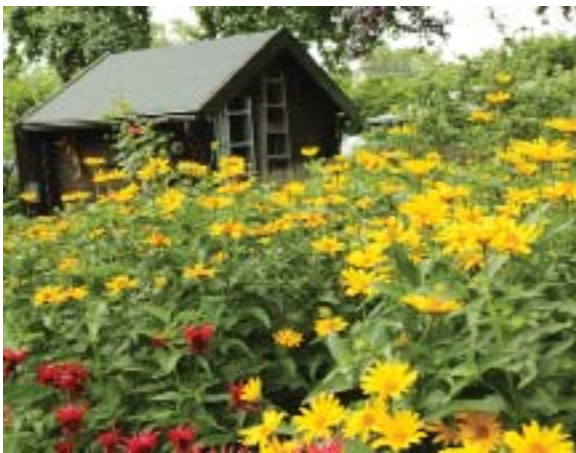
Seit 40 Jahren sorgt das Bundeskleingartengesetz dafür, dass die Blütenträume der Kleingärtner in Erfüllung gehen.

Seit 40 Jahren gibt es das BKleingG als Regelwerk für das Kleingartenwesen in Deutschland nun schon. Insbesondere der Kündigungsschutz sorgt für grüne Städte im Sinne von Umweltgerechtigkeit. Die soziale Gerechtigkeit spiegelt sich in den günstigen Konditionen zur Pacht eines Kleingartens wider. Denn angelehnt an ortsübliche Pachtpreise für Anbauflächen des gewerblichen Obst- und Gemüsebaus sind auch die Pachtpreise für einen Kleingarten moderat. Damit ist das Kleingärtnern ein vergleichsweise günstiges Hobby. Zudem garantiert das BKleingG, dass Kleingärtnerinnen und Kleingärtner unbefristete Pachtverträge erhalten, die nicht einfach gekündigt werden können.