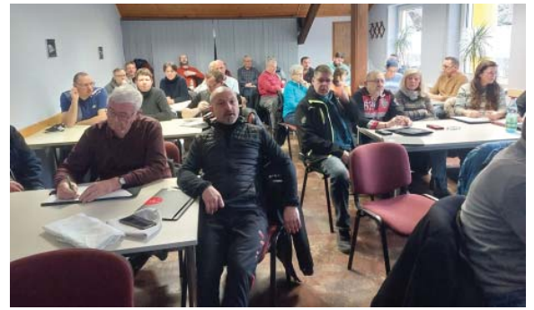
Fast vier Dutzend Gartenfreunde waren in Gotha zur Schulung für neue und erfahrene KGV-Vorstände gekommen.