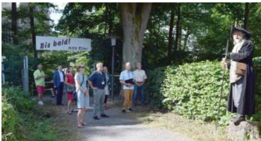
Ein Stadtrundgang mit einem Führer in historischer Tracht blieb den Juroren des 25. Bundeswettbewerbs 2022 bei der Begehung im KGV „Eller“ Sonneberg in bester Erinnerung.

Der Wettbewerb steht dafür, besondere städtebauliche, ökologische, gartenkulturelle und soziale Leistungen zu würdigen, mit denen Kleingärtnervereine über die Grenzen ihrer Gartenanlage hinaus positive Impulse in das Wohnumfeld senden. Zugleich wird mit dem Wettbewerb das bürgerschaftliche Engagement