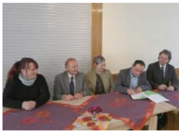
Die Vertreter der Kommunen und des Kleingärtnerverbandes unterzeichneten den Wettbewerbsaufruf 2023.