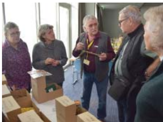
Im direkten Gespräch können Pflanzenschutzprobleme zumeist besser erörtert werden als online am Computer.