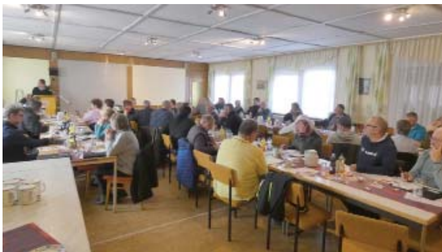
Die Vertreter der 68 Mitgliedsvereine des Verbandes der Kleingärtner in Eisenach und im Wartburgkreis trafen sich im Vereinsheim des Obst- und Gartenbauvereins „Palmental“.

„Unser Anliegen ist es, die Leistungen unserer rund 2.700 Pächterfamilien in 68 Kleingartenanlagen bei der Pflege von Natur und Umwelt und somit bei der Bewahrung einer möglichst großen Artenvielfalt im sich vollziehenden Klimawandel zu würdigen“, betonte die Vorsitzende. „Unsere Kleingärtner pflegen einen beachtlichen Anteil des öffentlichen Grüns der Kommunen unentgeltlich und bieten so den Einwohnern der Städte und Gemeinden ein attraktives Wohnumfeld, das in und nach der Corona-Pandemie zur aktiven körperlichen Betätigung ebenso einlädt