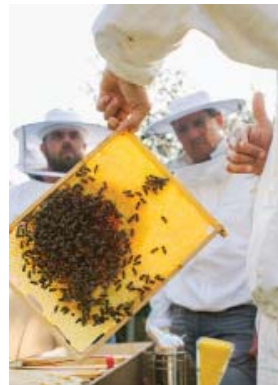
Bei Kursen werden Grundkenntnisse vermittelt.