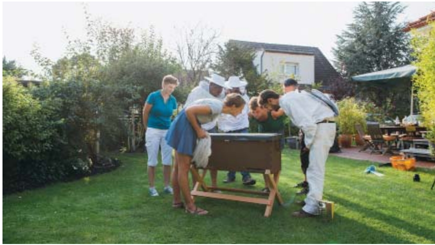
Die kompakte BienenBox dient der ökologischen Bienenhaltung und gewährt spannende Einblicke in das Leben und die Arbeit des Bienenvolkes.

Unbestritten ist, dass gerade ein Kleingarten bzw. eine Kleingartenanlage mit der großen Artenvielfalt und Blütenpracht vom zeitigen Frühjahr bis zum späten Herbst eine durchgehend blühende Bienenweide für eine ökologische Bienenhaltung bietet. „Doch nicht in allen KGA ist die Bienenhaltung auch erlaubt“, gab die Referentin zu bedenken. „Deshalb ist es ratsam, von Anfang an über sein Vorhaben sowohl mit dem Vorstand als auch mit den Gartennachbarn zu sprechen, um eventuelle Vorbehalte abzubauen und für die Bienenhaltung als Mehrwert