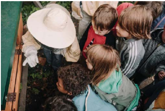
Mädchen und Jungen sind begeistert, wenn sie Bienen bei ihrem Treiben beobachten können.

Wer sich danach zum Besuch eines Imkerkurses für EinsteigerInnen entscheidet, bekommt diese Seminargebühr auf den Kurspreis gutgeschrieben. Diese Kurse starten im April und im Mai in 26 Städten in